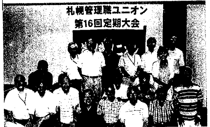
札幌管理職ユニオン 第16回定期大会